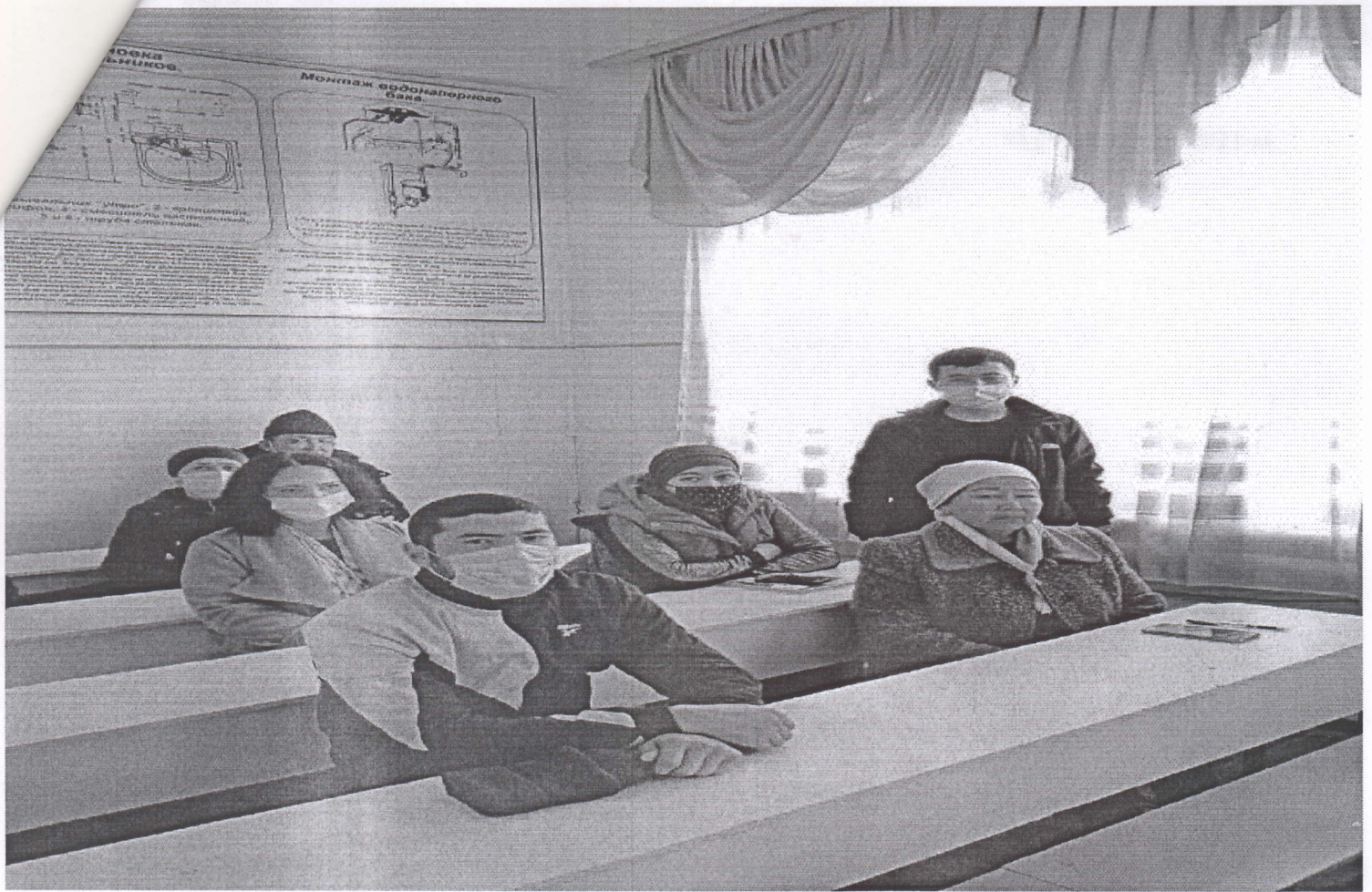
1. Классы оборудованы компьютерами и интернетом 2. Студенты не только получают знания, но и развивают навыки