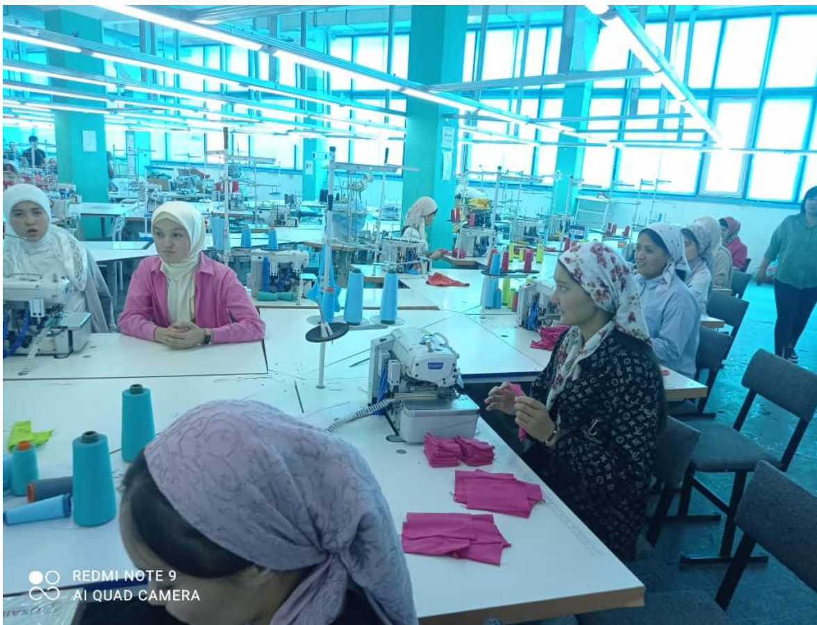
Обход производственного директора, текущий инструктаж.