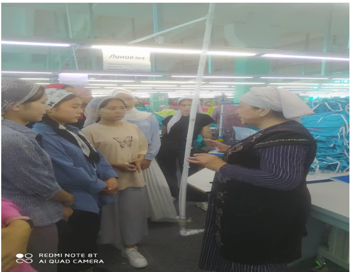
Вводный инструктаж ознакомление с работой по технике безопасности урок охрана труда и техника безопасности на предприятии.