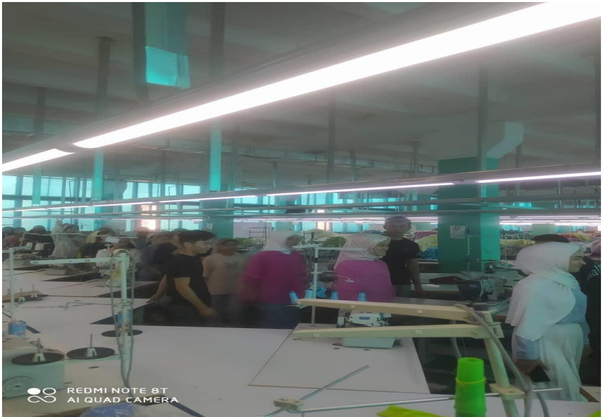
Урок организация тех процесса швейного производства ознакомление с технологическим процессом производства, экскурсия по предприятию по всем отделам.