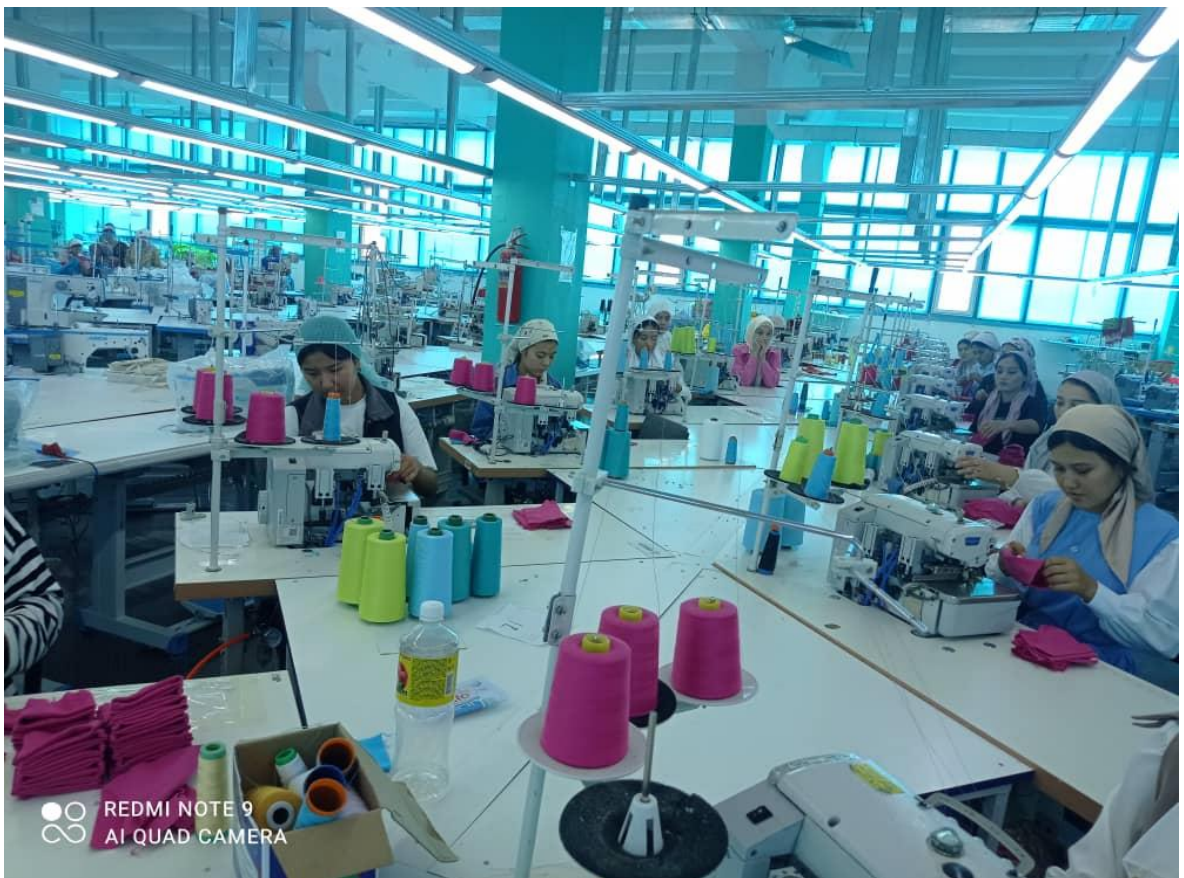
На уроке ТШИ пошив манжет.