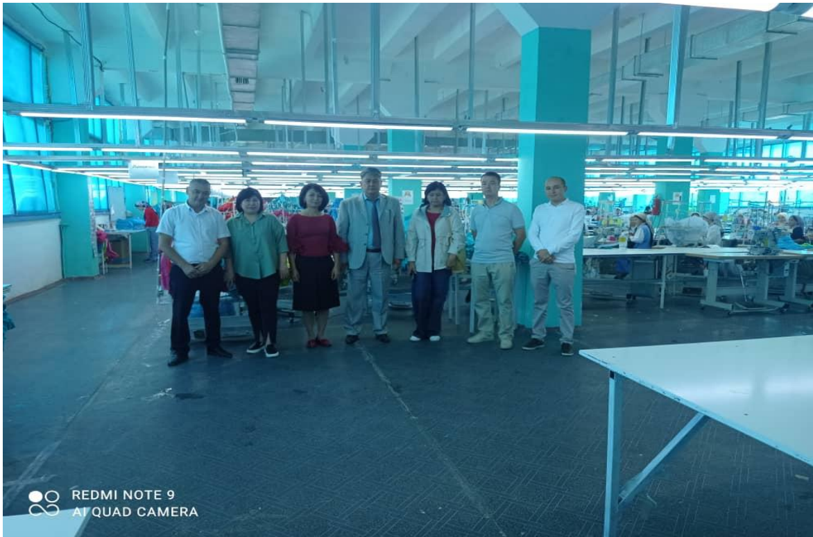
Посещение гостей предприятия.