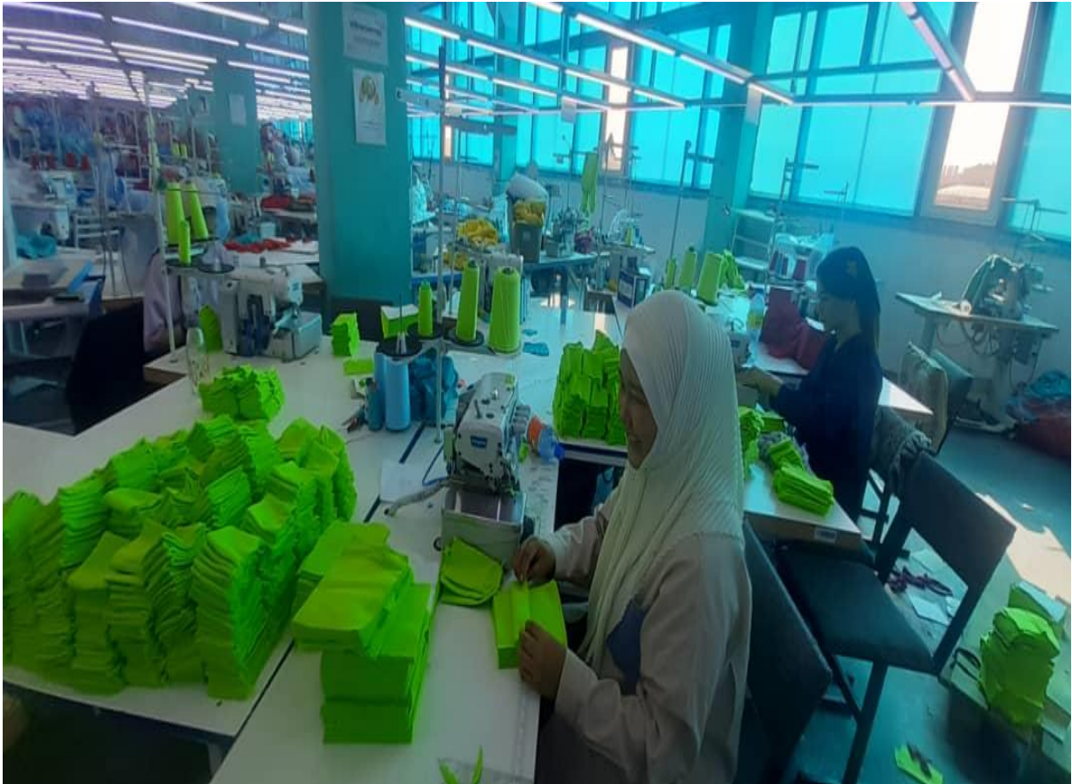
Студентки на потоке по пошиву манжет.