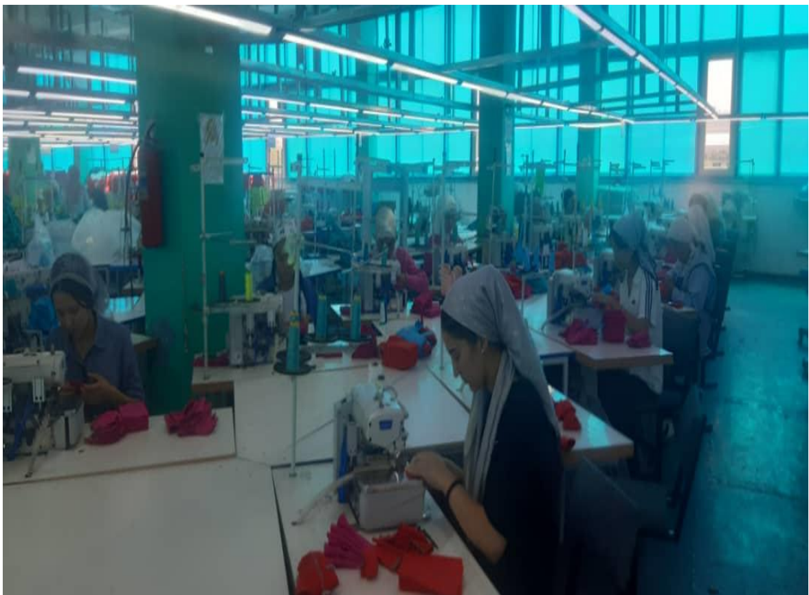
Урок ТШИ процесс работы с оборудованием, цепного стежка. Пошив манжет.