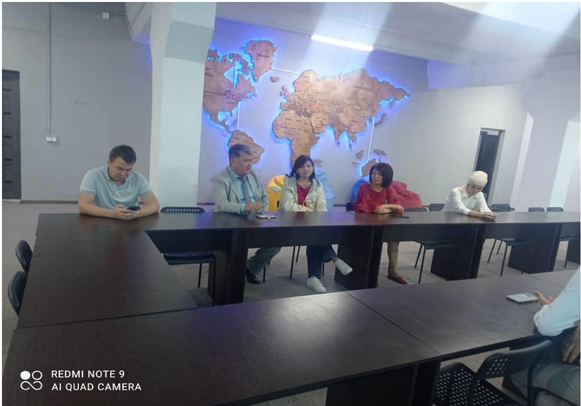
Конференц зал от предприятия, где проходят занятия во время ОРМ.