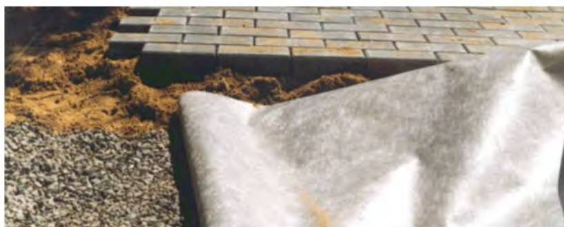
Рис.4. Укрепление грунта

Материал целесообразно укладывать под плитку (тротуарную), на склонах, при обустройстве искусственных водоемов и в других подобных случаях. "Дорнит" препятствует прорастанию корней растительности, вымыванию почвы (снижает ее эрозию), компенсирует растягивающие напряжения, перераспределяя нагрузку на грунт.