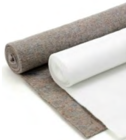
Рис.1. Нетканное геополотно "Дорнит"

"Дорнит" - полотно преимущественно нетканое, основой которого является полипропилен. Микропоры в материале делаются иглопробивным способом (рис.1).