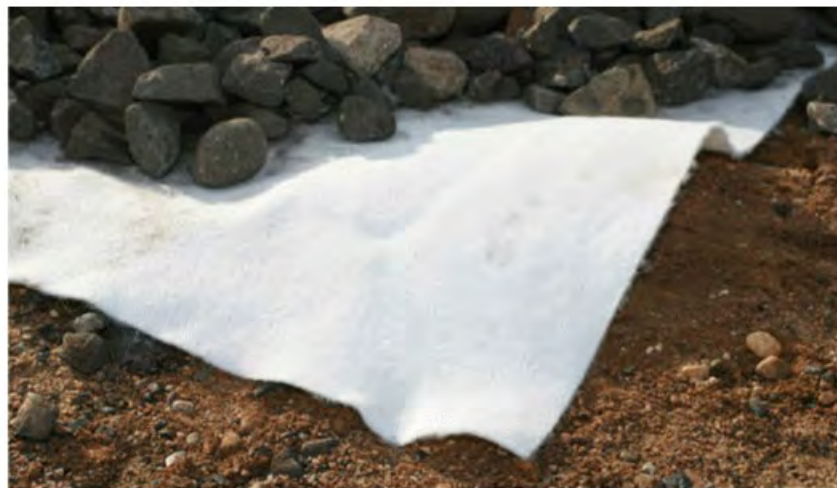
Рис.3. Система дренажа