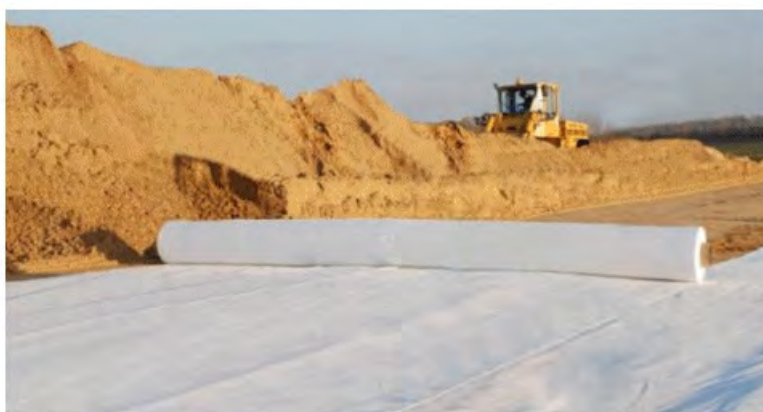
Рис.2. Дорожное строительство

"Дорнит" выполняет функцию разделительного слоя между песком (щебенкой) и грунтом. Это позволяет несколько снизить расход насыпных материалов и повысить долговечность дорожного полотна (исключается появление трещин в покрытии). Следовательно, снижается себестоимость 1 км трассы.