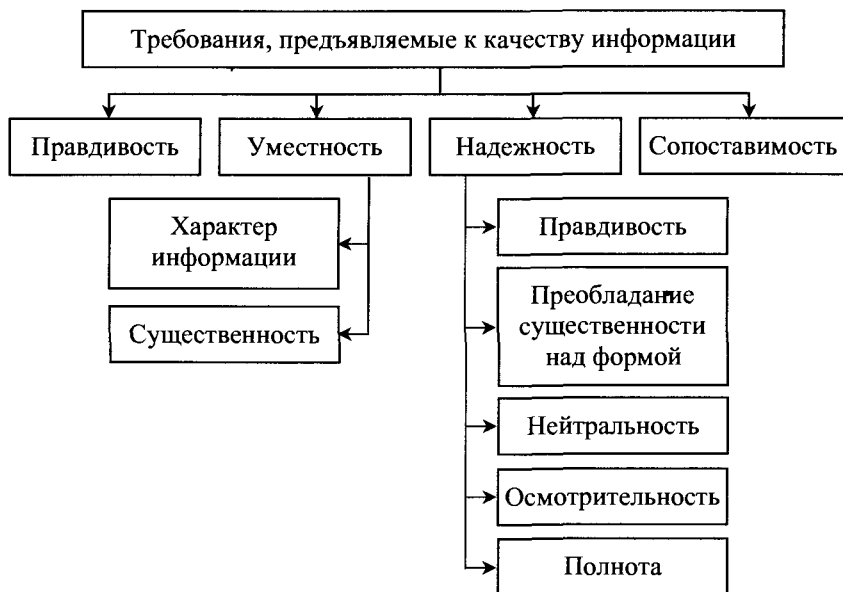
Рис. 1.3. Качественные характеристики информации в системе МСФО

Качественные характеристики информации представлены на рис. 1.3.