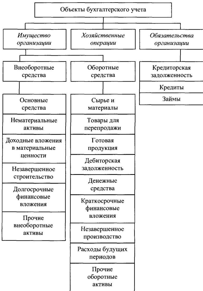
Рис. 1.4. Классификация объектов бухгалтерского учета