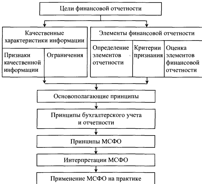
Рис. 1.2. Концептуальные основы международного бухгалтерского учета

МСФО лежат сами международные стандарты и концептуальные основы составления отчетности.