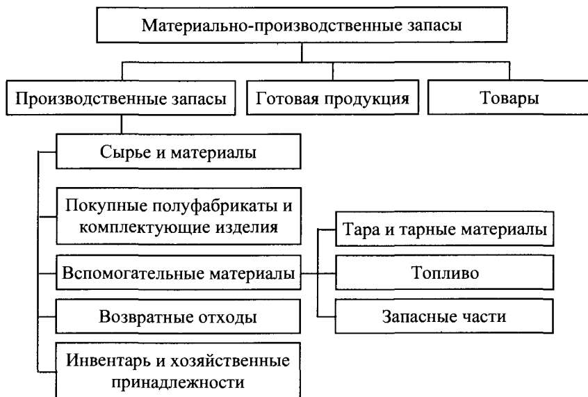
Рис. 5.1. Классификация материально-производственных запасов