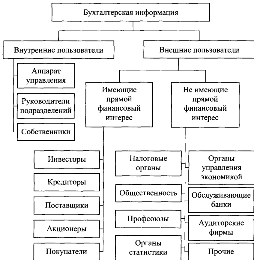
Рис. 1.1. Состав пользователей бухгалтерской информации

3) поставщики и подрядчики заинтересованы в информации, позволяющей определить, будут ли выплачены в срок причитающиеся им суммы;