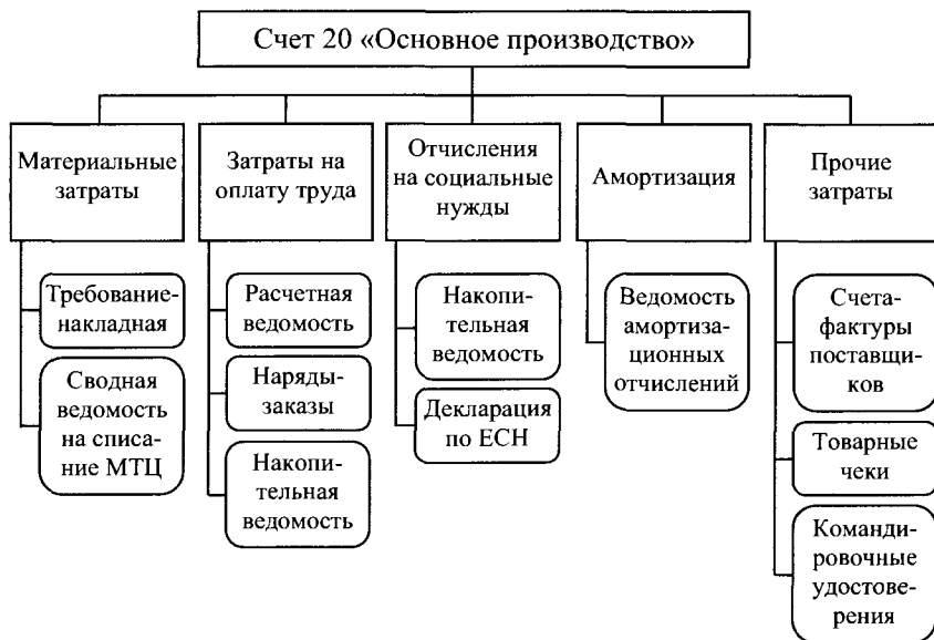
Рис. 6.1. Первичные документы по учету прямых затрат

Записи по учету косвенных затрат осуществляют по дебету счета 20 «Основное производство» на основании специальных расчетов распределения данных затрат.